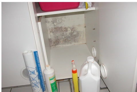
Photo 39.6 : Moisissures se développant à l'intérieur d'une armoire

Plusieurs milieux gélosés ont été sélectionnés en vue d'évaluer l'environnement (surfaces et air) à partir d' indicateurs bactériens (tableau 39.7). Ces indicateurs permettent dans un premier temps d'évaluer le bruit de fond (niveau de pollution de base) rencontré dans de nombreux établissements pour la petite enfance, et d'établir une échelle de référence (en l'absence de normes existantes). Ils peuvent également être utiles pour apprécier l'efficacité des produits d'entretien et de désinfection.